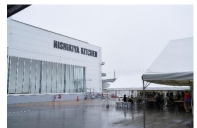
にしき食品空港南工場

は初めて、2020年に完成した、にしき食品空港南工場での開催となりました。にしき食品の社員が全員参加し、9時～12時までの約3時間、来てくださった方々をおもてなしました。